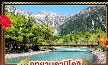
อุทยานคามิโคจิ