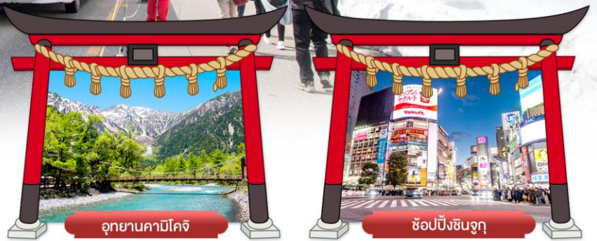
อุทยานคามิโคจิ